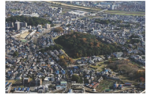
2. 藤井寺市 古墳のある街並み