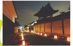
6. 富田林市 寺内町の街並み