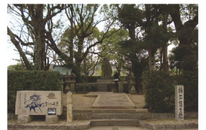
12. 千早赤阪村 楠木正成の誕生地