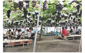
3. 柏原市 ぶどう狩り