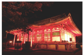
11. 河内長野市 観心寺金堂