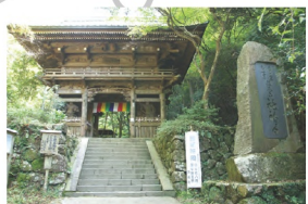
10. 和泉市 施福寺