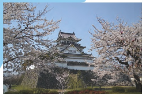
9. 岸和田市 岸和田城