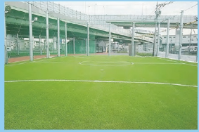
1. 松原市 スポーツパークまつばら