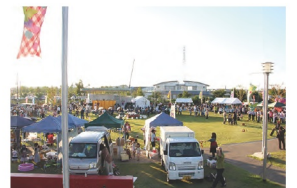
4. 羽曳野市 軽トラ市