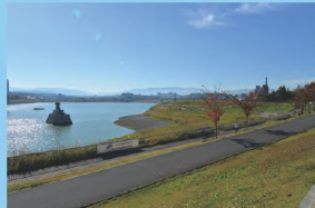
5. 大阪狭山市 狭山池