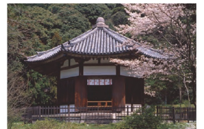
15. 五條市 柴山寺の八角堂