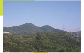
7. 太子町 二上山