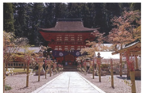
13. かつらぎ町 丹生都比売神社